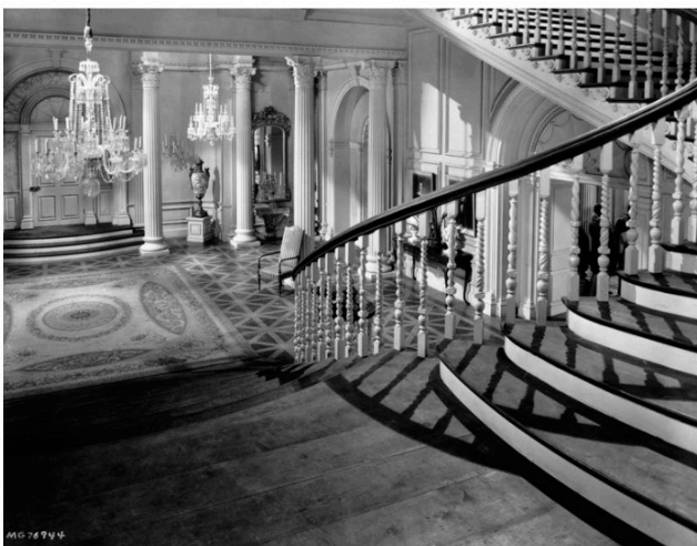
Escaleras de la película Lo que el viento se llevó .