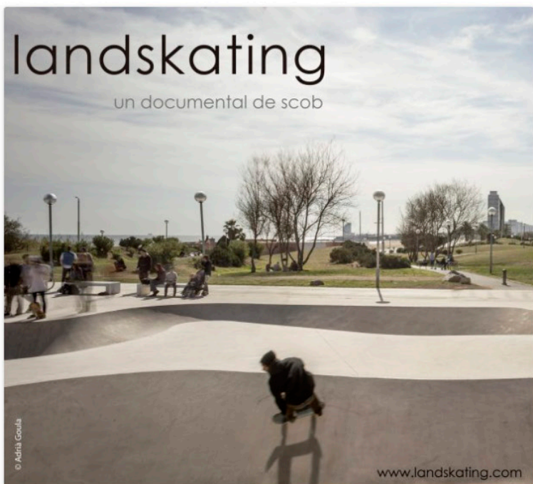
Documental "landskating" espacio público recuperado para ser vivido.

El ciclo contará con el cortometraje Landskating , un espacio público recuperado para ser vivido. La transformación de Lisboa a velocidad de crucero (Terramotourism). Una vivienda "low cost" con una envolvente acristalada y otra realizada con la mitad del presupuesto original. El abandono del frontón madrileño Beti Jai o de la central eléctrica Battersea Power Station . Y una sensacional vivienda construida en un acantilado. Los arquitectos, autores de los cortometrajes o expertos en materia debatirán con el público tras las sesiones