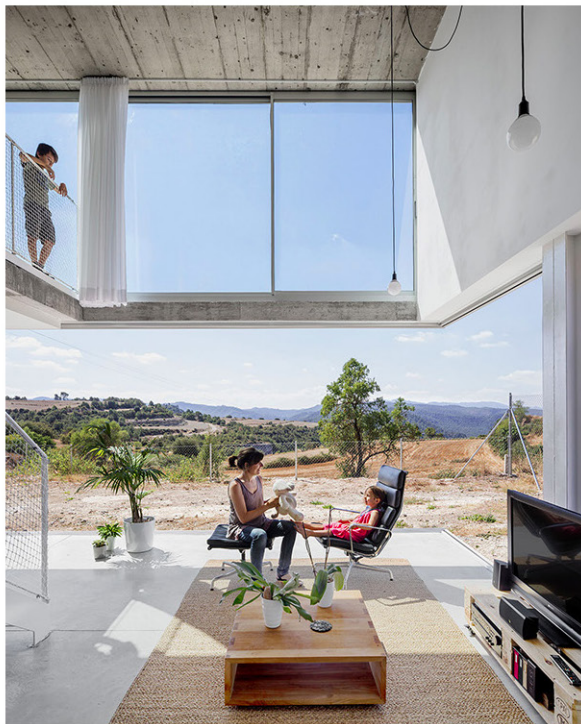
VIVIENDA EN CALDERS DEL ESTUDIO NARCH